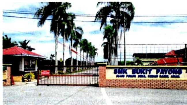
SMK Bukit Payong adalah antara empat buah sekolah yang ditutup di daerah Baling dan Pokok Sena, Kedah bermula semalam sehingga 17 Oktober.

Sekolah yang telah ditutup di Putrajaya ialah Sekolah Menengah Kebangsaan (SMK) Precint 8 (1)