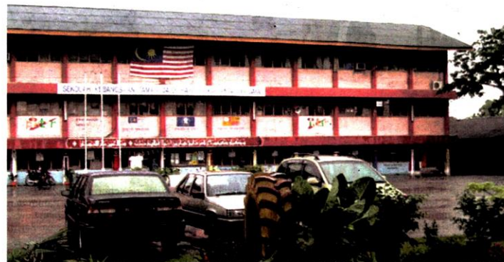
SK Taman Dato' Harun 2, Petaling Jaya antara 298 sekolah di daerah Petaling yang diarahkan tutup hari ini.

Katanya, sekolah yang mempunyai asrama termasuk Kolej Vokasional juga ditutup dan ibu bapa serta penjaga perlu mengambil murid yang tinggal di asrama tersebut untuk pulang.