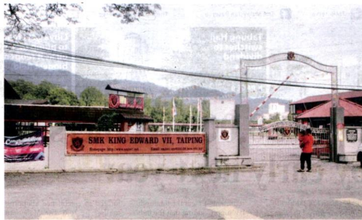
SMK King Edward VII in Taiping, Perak, which reported a positive Covid-19 case involving a staff member, is closed for a week starting Sunday

Eleven of the local transmissions were found to be individuals who had returned from Sabah, bringing