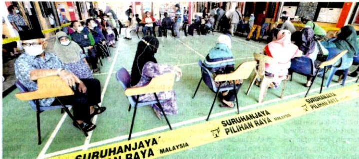
Orang ramai menunggu giliran untuk mengundi pada PRN Sabah ke-16 baru-baru ini. Mengikut peruntukan Perlembagaan Persekutuan, SPR perlu mengadakan pilihan raya untuk mengisi kekosongan kerusi yang wujud dalam tempoh 60 hari.

Fasal 1 Perkara 54 Perlembagaan Persekutuan berbunyi, "kecuali sebagaimana yang diperuntukkan di bawah Fasal (3) (keputusan mengenai kehilangan kelayakan), apabila terdapat sesuatu kekosongan dalam kalangan ahli Dewan Negara atau sesuatu kekosongan luar jangka dalam kalangan ahli Dewan Rakyat, maka kekosongan atau kekosongan luar jangka itu hendaklah diisi dalam tempoh 60 hari dari tarikh dipastikan oleh Yang Dipertua Dewan Negara bahawa ada kekosongan atau oleh SPR