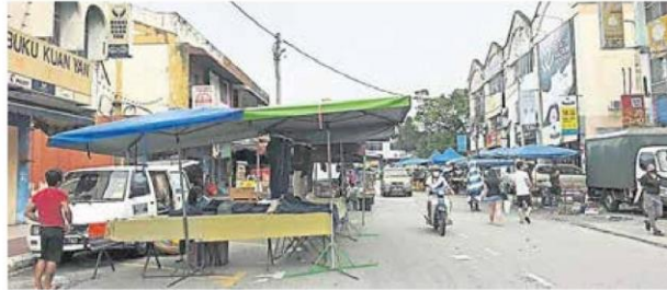
■巴生永安镇并没实施有条件行管令, 所以允许开业, 但人潮明显减少。

(巴生11日讯) 由于巴生县的界限不明, 引起早夜市小贩疑惑和担忧, 并盼巴生市议会清楚说明能营运的早夜市, 避免小贩违例, 抵触冠病标准作业程序。