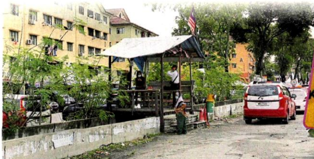
■加限区和非加限区的沟渠上方, 居然有座凉亭, 可以自由出入。

巴生5个“加限区”之一的高阳苑公寓区, 尽管所有出入口都已封锁, 惟当地呈四方形的封锁区, 其中2个方向是面向大路的2排商店, 虽然中间隔着沟渠, 但居民仍可直接步行跨出沟渠, 直接“走”出加限区。 而且, 2排商店区各有约半公里至1公里长, 成为2条长长的“老鼠路”。 根据《中国报》记者观察, 尤其是北卡卡通 (Persiaran Pegaga), 由于范围