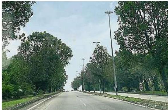
居民申诉公主城中央公园约400公尺主要通道虽然仍未正名,但却有街灯,理应由士拉央市议会负责维修。