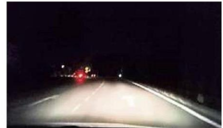
从菁乡岭路口转向公主城的打昔布特丽路街灯失灵,在居民投诉3个月,当地依然是黑暗一片。

他强调,该区街灯失灵至今已有多月,市议会应以居民的道路安全为重,减少维修工程的繁文缛节,尽速修复街灯。