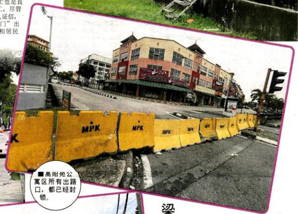
■高阳苑公寓区所有出口, 都已经封锁。