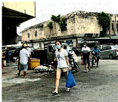
池龙花园早市有小贩偷偷营业，巴生市区流动商贩公会呼吁违例者自负。

莎阿南市政府基于消费者和小贩有跨界问题，昨日也指示关闭旗下 11 个靠近巴生县的夜市，包括 17 区、25 区、20 区、31 区、34 区、36 区，以及实达阿南 U13 区，以避免出现冠病传播问题。