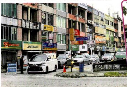
■许多居民没经过唯一的正规出入口, 导致防疫漏洞。