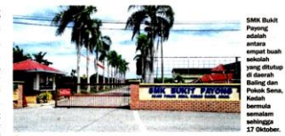
SMK Bukit Payong adalah antara empat buah sekolah yang ditutup di daerah Baling dan Pokok Sena, Kedah memabatkan seramai sehingga 27 Oktober.

Sekitar satu juta pelajar yang belajar di 1,754 buah sekolah di beberapa negeri di Malaysia tidak dapat menjalani sesi persekolahan seperti biasa selepas kes pandemik koronavirus (Covid-19) meningkat semula. Sabah mencatatkan jumlah penutupan sekolah yang paling tinggi iaitu sebanyak 1,296 buah sekolah yang melibatkan seramai 500,000 pelajar. Penutupan sekolah mulai 10 Oktober sehingga 25 Oktober itu terpaksa dilakukan selepas kes-kes Covid-19 di negeri itu masih menunjukkan peningkatan. Semalam, Kementerian Pendidikan Malaysia (KPM) turut mengambil keputusan yang sama untuk menutup sebanyak 298 buah sekolah di seluruh daerah Petaling di Selangor mulai 12 Oktober hingga 25 Oktober.