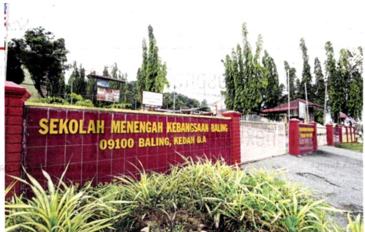
SMK Baling is one of three schools ordered to close in Kedah.

"Teaching and home-study manuals can be downloaded from the ministry's official web-