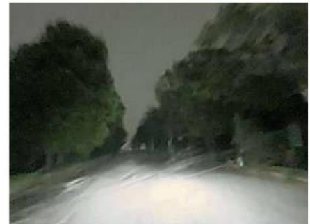
在入夜后,公园旁的主要通道便陷入黑暗,使居民的回家路添了危险。