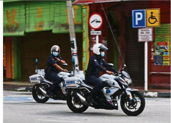
Policemen on patrol around Klang, where 36 neighbourhoods have been placed under conditional MCO since Oct 9.

Puspavali said those who wished to volunteer, or contribute food items or money can call 012-480 3800.