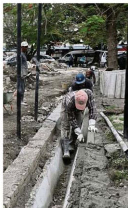
Upgrading work in progress along Jalan Berjaya 10, Sungai Chua in Kajang.

Khoo added that he would also hold a dialogue with business owners to fine-tune existing guidelines of their operations during the recovery movement control order once the number of Covid-19 cases had gone down.