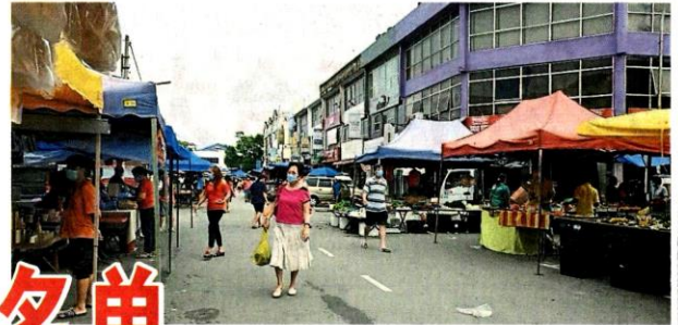
周日时段，永安镇早市一向人潮汹涌，如今则是档口多过消费者。

“据悉，市议会官员已前往警告，不过，仍有冥顽不灵者持续营业，尤其趁官员未到来的时段，比如上午 8 时前开档，借此避开被取缔。”