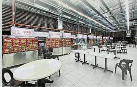
虽然巴生卫星市隶属加埔副县，惟基于当地存有冠病潜在风险，因此食肆业者必须遵循有条件行管令，在这14天内禁止堂食，只能让食客打包食物。

巴生卫星市从本月9日起至23日期间，区内所有食肆和餐厅禁止堂食，只能提供打包外带服务、早夜市也不能运作。